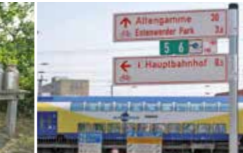
Mit dem Metronom zurück nach Hause