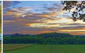
Stressfrei Radeln mit Weitblick