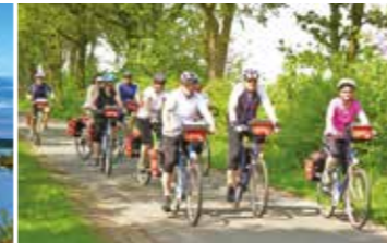
Mit Freunden unterwegs