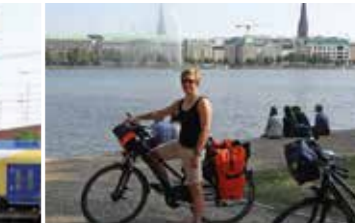
Hamburgs Binnenalster, ein lohnendes Ziel