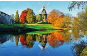
Bremer Mühle am Wall