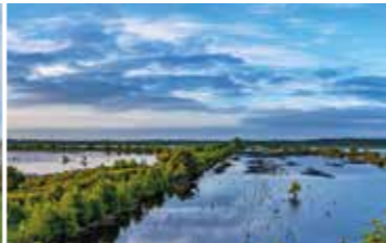
Weite Wasserflächen des Tister Bauernmoores