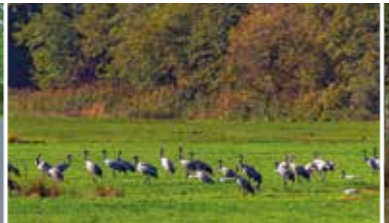
Kraniche rasten zur Vogelzugzeit im Frühjahr und Herbst an der Route