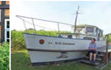
Nartumer Hafen ganz im Grünen