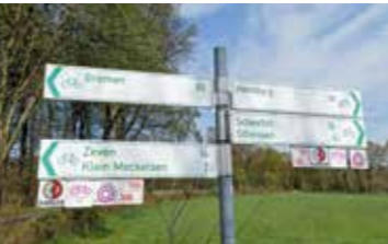
Hier geht es lang