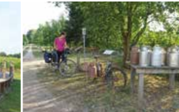
Milchbank in Heidenau