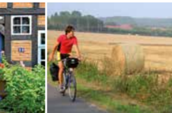
Auch zur Erntezeit eine tolle Tour