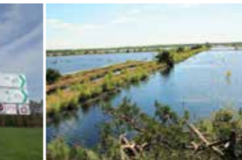
Weite Wasserflächen des Tister Bauernmoores