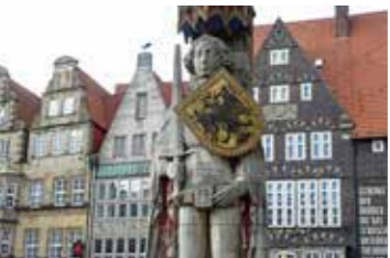
Der Schutzpatron Roland auf dem Bremer Marktplatz