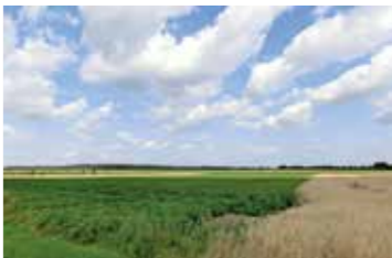
Stressfreies Radeln mit Weitblick