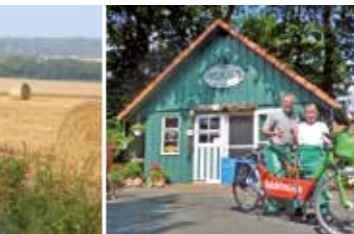
Stärkung in der Milchraststätte