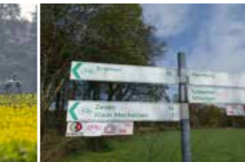
Hier geht es lang