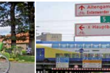
Mit dem Metronom zurück nach Hause