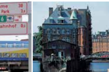
Hamburgs Speicherstadt gehört zum UNESCO-Weltkulturerbe