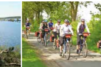
Mit Freunden unterwegs