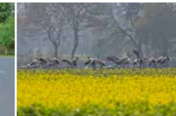
Kraniche rasten zur Vogelzugzeit im Frühjahr und Herbst an der Route